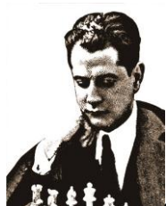
José Raúl Capablanca